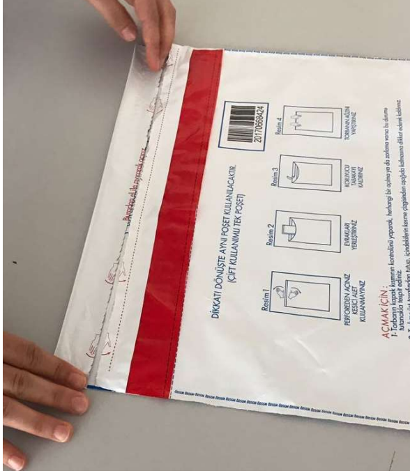
Resim-7 Kırmızı şeride dokunmayınız.