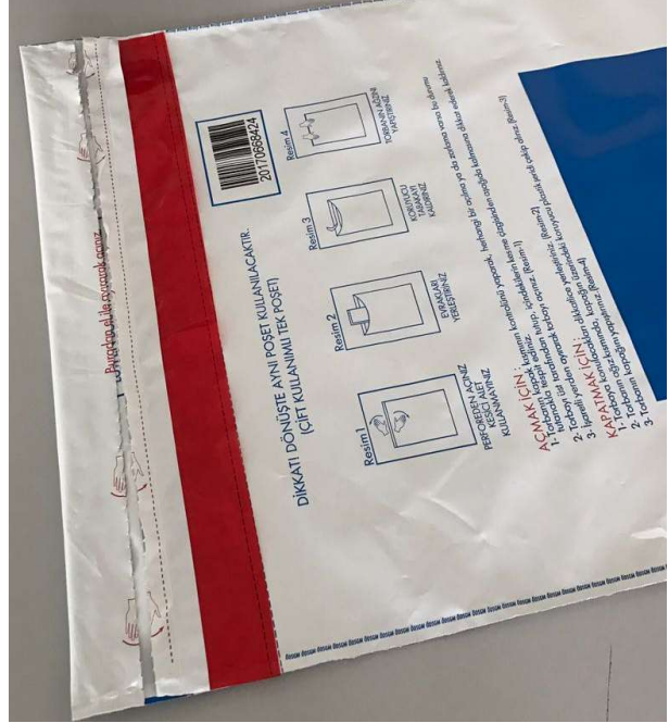
Resim-8 Sınav güvenlik poşetini Resim-8'deki gibi ağzı kapalı olarak bina sınav komisyonuna teslim ediniz.

İletişim Numaraları: 0 312 413 46 16- 413 32 80 - 413 32 83 - 413 32 47- 413 32 48