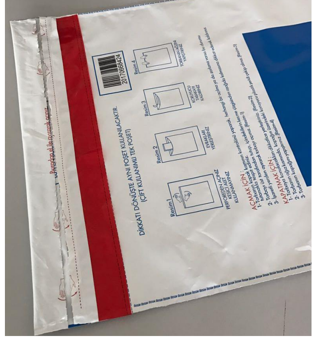
Resim-8 Sınav güvenlik poşetini Resim-8'deki gibi ağzı kapalı olarak bina sınav komisyonuna teslim ediniz.

İletişim Numaraları: 0 312 413 46 16- 413 32 80 - 413 32 83 - 413 32 47- 413 32 48