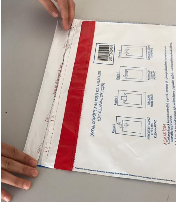
Resim-7 Kırmızı şeride dokunmayınız.